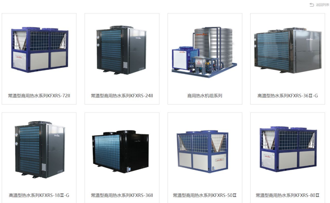
图 1-1 产品介绍

真心热能是一家从事电磁热水器、太阳能热水器、热泵热水器、取暖及配件生产、销售的企业，销售网络遍布全国各地，在国内已拥有 1000 多家销售网点，在空气能行业更是成为了行业内先驱。哪里有销售网点哪里就有售后网点，能更好的服务于广大的消费者。除了在国内的 1000 多家销售网点外，深受外国消费者的信赖和好评。专业的营销推广和售后服务使得真心热能的企业形象更加深入人心。